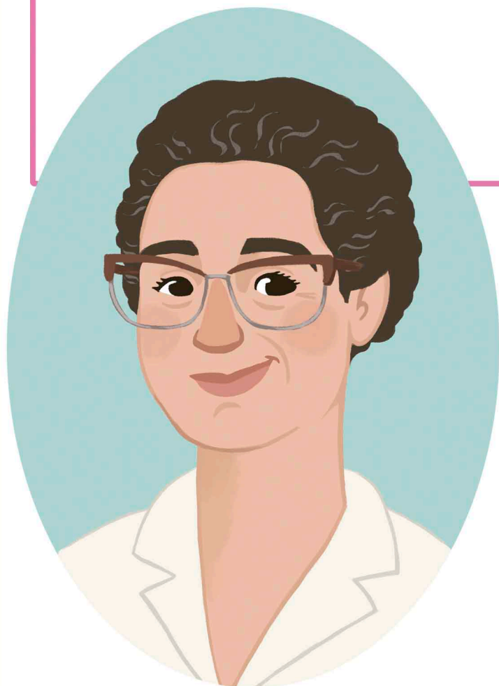
Ilustracións: Tania Solla Textos: Polo Correo do Vento